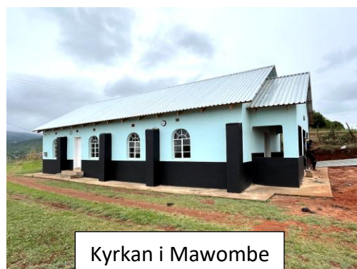
Kyrkan i Mawombe

Akut behövs ca 300.000 kr för att grundarbetena skall kunna startas. Märk din gåva med ”kyrkbygge”.