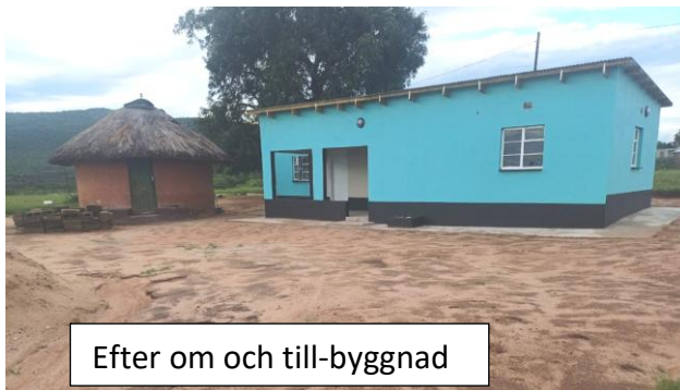
Efter om och till-byggnad

Taken läckte i båda ”husen”. Rätt sorts gräs för att reparera hyddan finns inte att få tag på. Vi bestämde att renovera deras gamla ”hus” och bygga till med ett sovrum, badrum, mindre kök och veranda. I slutet av 2024 påbörjade vi arbetet och i januari 2025 flyttade de in i sitt nya hus.