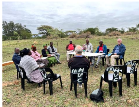
Första planeringsmötet på tomten i nov-24

OBS! Vi söker efter en bygglaser att ta med för projektet.