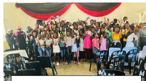
Under året deltog 1.395 tjejer i ett av våra seminarier

Vi har anställt en ledare på halvtid för att organisera seminarierna samt också ha möjlighet till, att vid behov, möta tjejer för enskilda samtal. Vårt arbetsområde utgör ca 15 x 5 mil och vi har en projekt-bil för projektets transporter. Tyvärr har bilens växellåda gått sönder. Bilen har nu varit på olika verkstäder i tre månader. Ibland får vi hyra en taxi för transporter till seminarierna. F.n. planeras för flera seminarier i mars. Kanske vi måste byta bil.